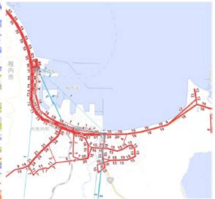
稚内市（宗谷バス・北都交通）