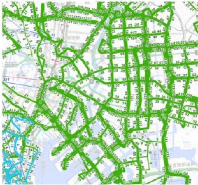
東京都（都営バス・港区ちいばす）